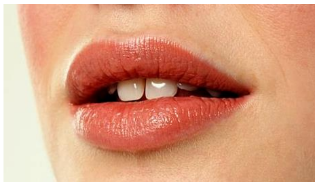
Szépségünk és egészségünk záloga!

A rendszeres szűrővizsgálat nem csak egészségünk hanem szépségünk megőrzésében is kulcsfontosságú!