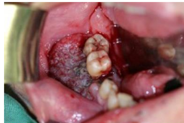
A nem gyógyuló seb!

Ha régóta meglévő, nem gyógyuló seb az első jel, akkor az gyakran ott látható, ahol egy rosszul nőtt, letört vagy lyukas fog amúgy is sérti a szájnyálkahártyát vagy az ínyt, így - ennek tulajdonítva a sebet - nem megyünk orvoshoz, ezért nem derül ki időben a baj.