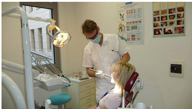
A vizsgálat életet menthet!

Az időben történő felfedezés pedig a hatékony, gyógyulást hozó terápia esélyét jelenti a beteg számára!